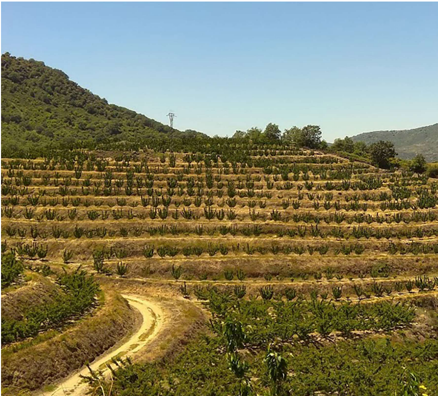
Foto 2. Detalle de nuevas plantaciones de cerezo en bancales en el Valle del Jerte. Vista general del ensayo situado en una parcela comercial de la empresa Campo y Tierra del Jerte.

problemas en el desarrollo fisiológico del cerezo (Fadón et al., 2015), lo que ha llevado en muchos casos a plantear la introducción del riego en zonas tradicionales de secano.