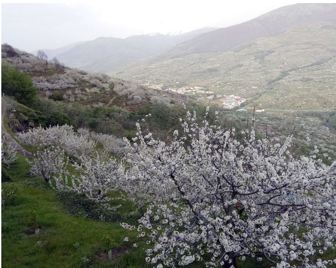
Foto 1. Vista panorámica del Valle del Jerte con cerezos en flor.