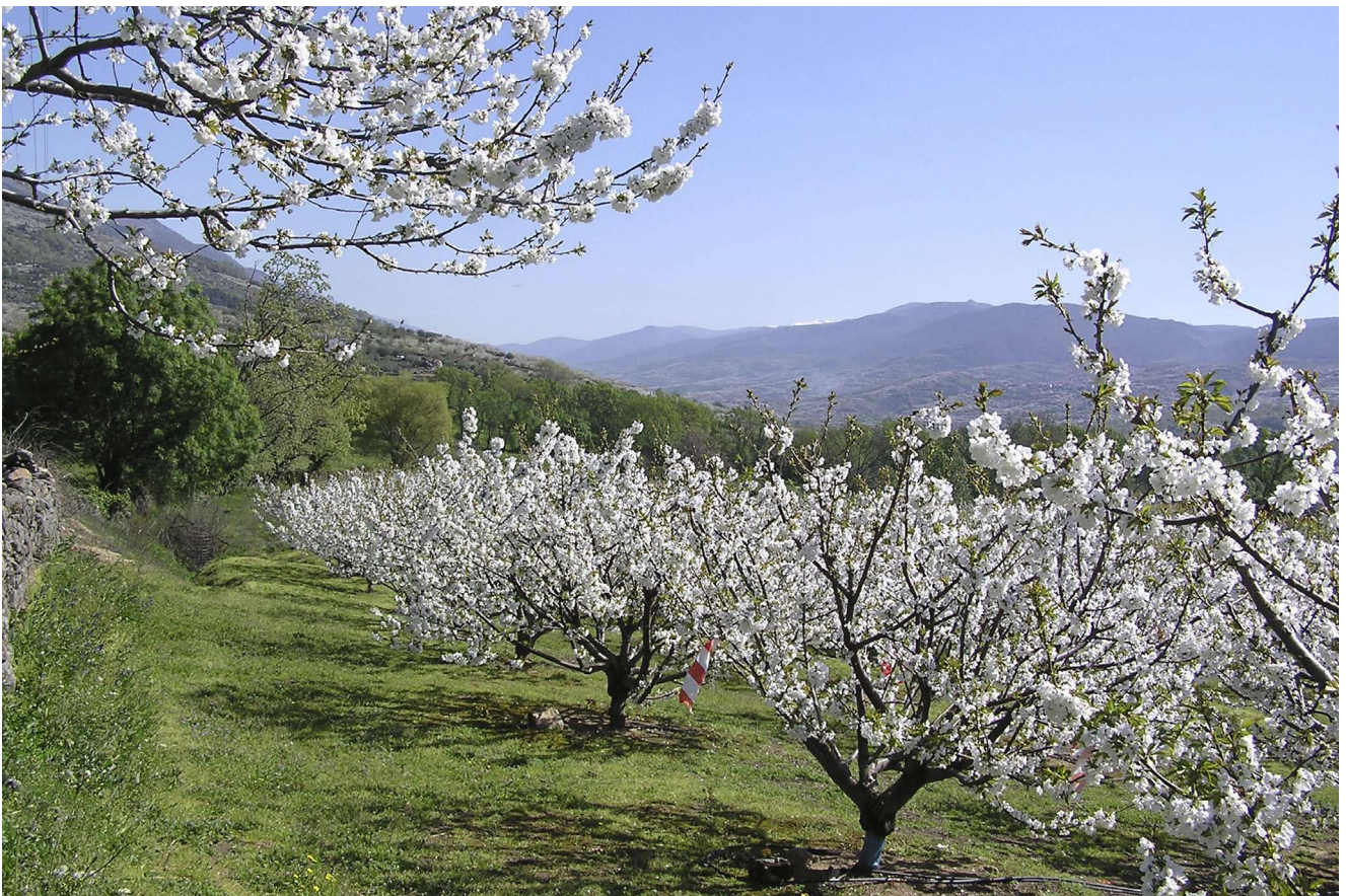
Foto 3. Vista general del ensayo de Riego Deficitario Controlado situado en una parcela comercial de un agricultor socio de la Agrupación de Cooperativas del Valle del Jerte.

En casos de escasez de agua los objetivos del riego deben enfocarse a obtener el máximo rendimiento